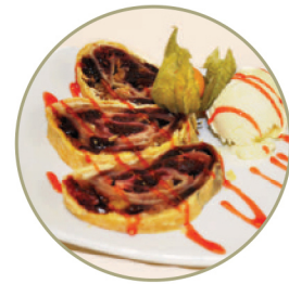
Штрудель Вишнёвый или яблочный штрудель. Подаётся с шариком мороженого .....230 г