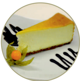
Чизкейк «Нью-Йорк» .....125 гр.