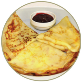
Блинчики .....180 г