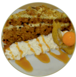
Морковный пирог от А.С. Грибоедова .....200 г

Cherry or apple strudel with icecream ball