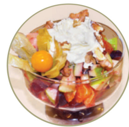
Фруктовый салат .....220 г