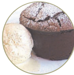
Шоколадный фондан .....150 г