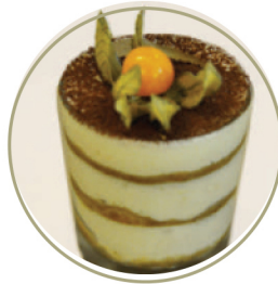
Торт «Тирамису» .....150 г

Pancakes with condensed milk or berry jam