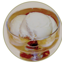
Сливочное мороженое .....100 г